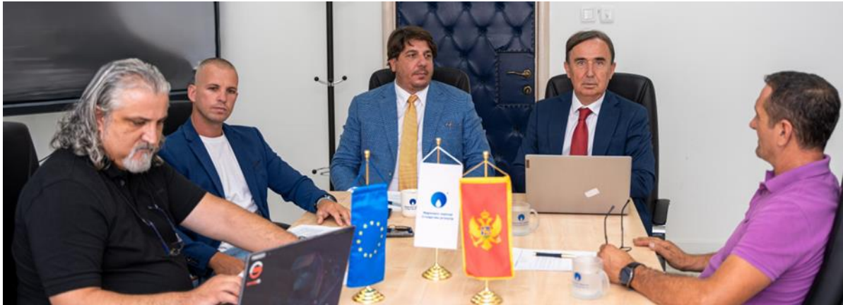
Odbor direktora u novom sastavu je tokom 2025. godpine održao 30 sjednica