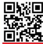
Скенирајте QR код вашим мобилним телефоним ако желите да видите видео снимак интервјуа.

– Регионални водовод може гарантовати да ће се све уговорене количине воде без проблема сервисирати, али се